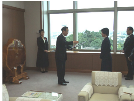
オーナー証書を授与される弊社社長夫妻

杉並木保護に賛同し出資した基金の運用益で並木杉の樹勢回復・自然環境保護を目的に平成8年より栃木県が実施している事業です。