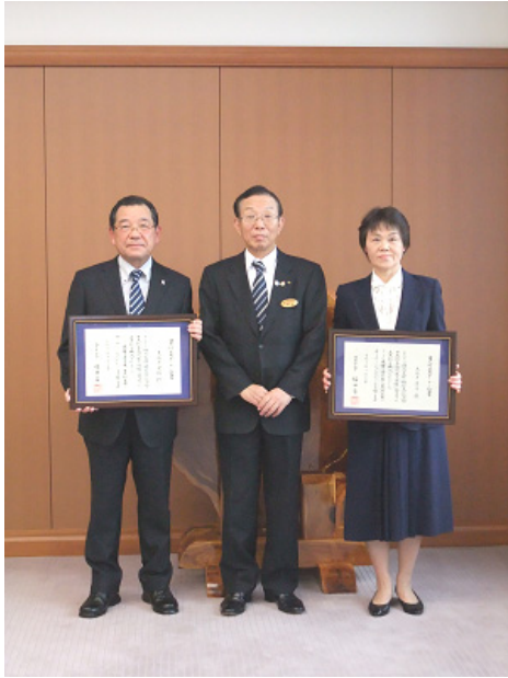
麻生栃木県副知事と記念撮影

《日光杉並木オーナー証書交付式》 2010/10/25 実施 於) 栃木県庁本館 9階特別会議室