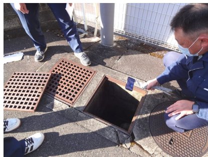
会社外周や油水分離槽を確認