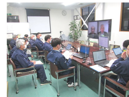
クロージング・ミーティング