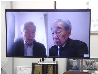
品質・環境を2画面で同時受審