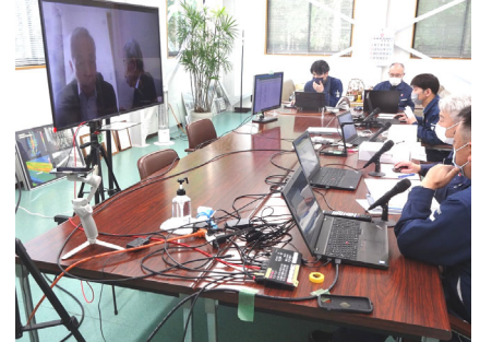
部門別の担当者が書類審査に应答