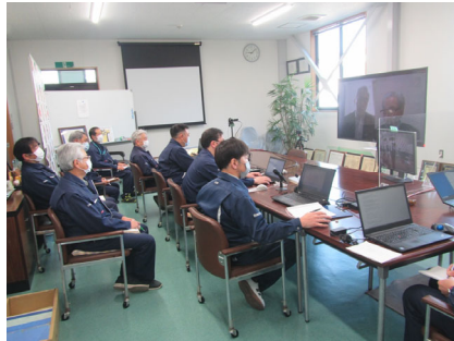
オープニング・ミーティング