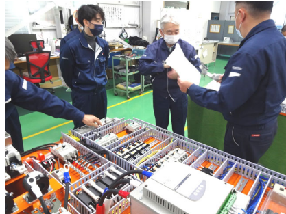
リモートによる現場審査