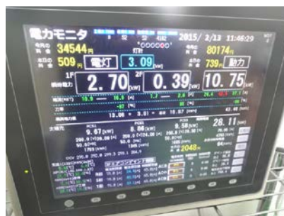
現在の発電量や消費電量が表示される電力モニタ