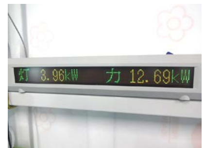
現在の消費電量を工場内に表示する電光掲示板

工場内や事務所に設置された電力モニタのグラフや数値で現在の発電量が把握できます。 発電量の表示と同時に、構内での消費電力も表示し、節電活動につなげています。