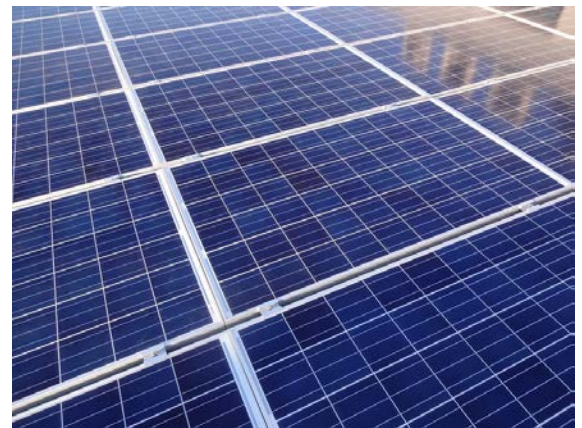
製品倉庫屋上に設置した太陽光発電システムのパネル