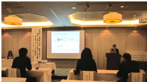
CSR 活動の事例発表をおこなう弊社 CSR 担当者