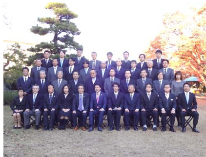
宇都宮市長と認証企業のみなさんと一緒に記念撮影