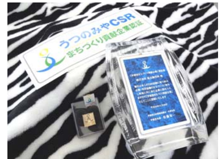
受賞した楕円ピンバッジ(2種類)とステッカー