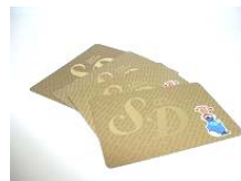
毎年全従業員に配付する SD カード