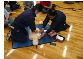
応急手当講習の受講(AED の使用方法)

これからも、(株)協立製作所は、安全運転管理を徹底し交通安全に最善の努力をおこない、配電盤・制御盤の設計・製造を通し、国家・社会に貢献できる企業を目指します。