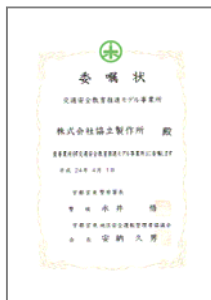
「交通安全教育推進行」事業所」委嘱状

ドライブレコーダーの全車両設置や SD カード・運転記録証明書の活用、従業員全員での車両点検や 3S 運動推進・エコドライブ(燃費計測・エコタイヤへの変更など)、QE 会議(品質と環境に関する会議)での安全運転啓蒙 DVD 視聴・消防署での応急手当講習(AED の使用方法の習得)の受講など弊社で実施している安全運転管理をご紹介します。