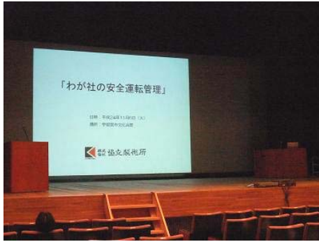
『わが社の安全運転管理』事例発表

一般社団法人栃木県安全運転管理者協議会様より、弊社に安全運転管理者等法定講習会での『わが社の安全運転管理』事例発表の講師派遣のご依頼があり、弊社の安全運転管理者による協立製作所『わが社の安全運転管理』事例発表を宇都宮市文化会館で行いました。