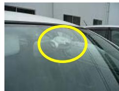
各社用車に設置してある ドライブレコーダー