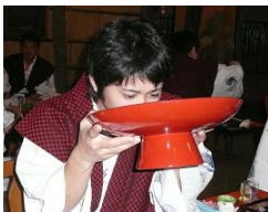
にごり酒の 大盃を仰ぐ