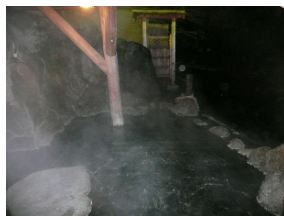
湯西川溪谷に手が届きそうな露天風呂