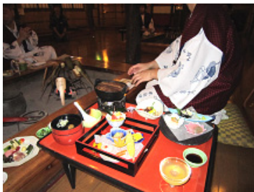
お膳には季節の食材が盛りだくさん