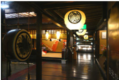
老舗旅館の重厚な雰囲気が漂う