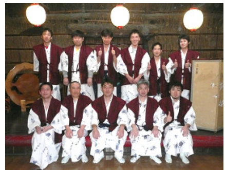
夕食前に記念撮影