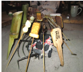
囲炉里端で若竹酒・一升べら 珍味の山椒魚・鮎の塩焼き etc.