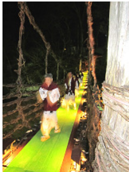
本州唯一の奇橋『かずら橋』揺れる・・・揺れる・・・