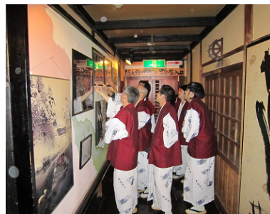
旅館の歴史を物語る 展示物にも興味津々